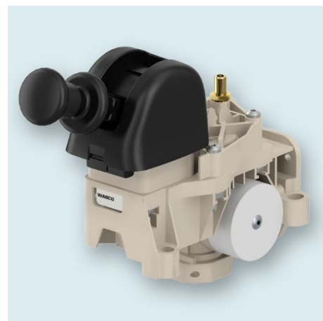
Válvula de freno de mano 961 724 800 0