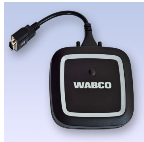
Interfaz de diagnóstico 3 de WABCO