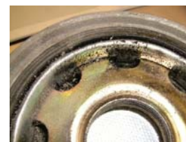
Figura 2: Con filtro de coalescencia: Air System Protector después de 60000 km